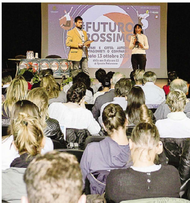
Il convegno dedicato ai giovani al Polaresco.