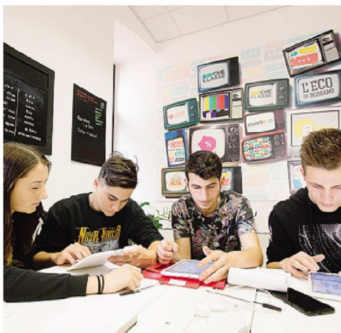
Scuola-lavoro al «MediaCenter» de L'Eco di Bergamo e Bg Tv. Una delle esperienze di alternanza più apprezzate sul territorio

La mini-riforma prevista dal ministro all'Istruzione Marco Bussetti nei prossimi mesi darà una sforbiciata a parte degli obblighi introdotti dalla legge della Buona Scuola: oltre a un taglio, nel Def, pari a 50 milioni di euro dei fondi riservati alle attività dell'alternanza, anche le ore a disposizione subiranno un calo. Secondo le anticipazioni, i licei non avranno più l'obbligo di garantire, dalla terza alla quinta, almeno 200 ore di alternanza, ma solo 90; per i tecnici si passerà da 400 a 150 mentre per i professionali da 400 a 180. Il nuovo monte ore sarà una soglia minima da garantire, ma ogni istituto avrà la libertà di investire tempo ulteriore per questo tipo di attività. «La revisione delle ore obbligatorie di alternanza scuola-lavoro – spiegano però fonti del Miur – non è una scelta improvvisa, ma ragionata, calibrata in base agli indirizzi di studio e attesa da docenti e studenti. Ha lo scopo di garantire maggiore qualità dei percorsi e di evitare esperienze poco edificanti per insegnanti e ragazzi