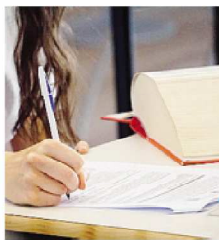
Novità alla prossima Maturità

mento. La votazione finale sarà sempre espressa in centesimi, ma si darà più peso al percorso di studi: il credito maturato nell'ultimo triennio varrà fino a 40 punti su 100 (invece degli attuali 25). Le prove scritte saranno due, al posto di tre. Eliminato il temutissimo quizzone, i maturandi saranno chiamati ad affrontare la prima prova di italiano il prossimo 19 giugno e la prova di indirizzo il 20. La prima prova