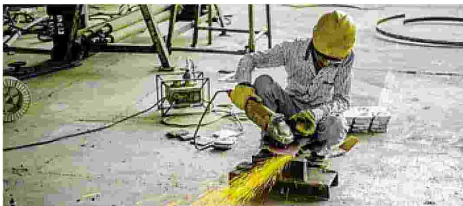
In Bergamasca c'è piena occupazione

Il tasso di disoccupazione nella nostra provincia, già storicamente basso, è arrivato ai minimi storici. Nel 2024, secondo gli ultimi dati Istat, si è dimezzato rispetto all'anno precedente ed è sceso all'1,5%, dato migliore in tutta Italia. A incidere sul risultato è stato in particolare l'aumento di donne in attività. Il tasso di occupazione femminile è salito dal 43,4% al 45%. Nel commentare i