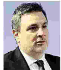
Paolo Piantoni Confindustria