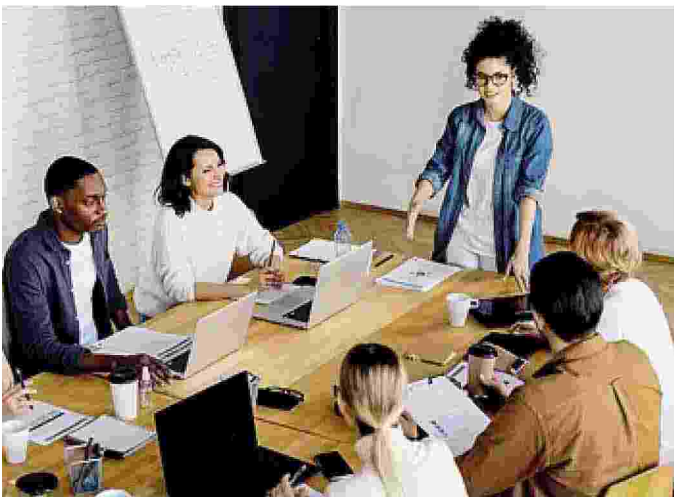
Oltre il 50% di chi emigra ha fra i 18 e i 39 anni

■ ■ Tanti giovani poi tornano per aprire qui nuove attività imprenditoriali»