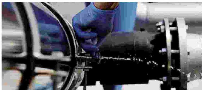
Un andamento ancora «a due velocità» per la meccanica bergamasca

==== Ancora un andamento da «montagne russe» nel quarto trimestre 2023 nella Bergamasca sul fronte della congiuntura meccanica: positivo per meccatronica, macchinari e soprattutto mezzi di trasporto (+4,1%), in calo per il comparto metallurgico-siderurgico, secondo i dati dell'Indagine congiunturale di Federmeccanica. «Il contesto d'inizio 2024 resta